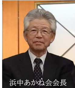
浜中あかね会会長