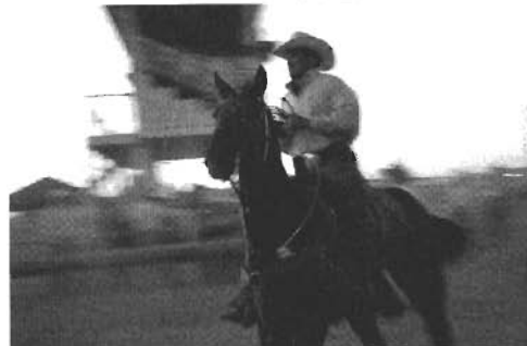
デルコンズでのフェスティバル。メインイベントの1つが、このロデオ大会