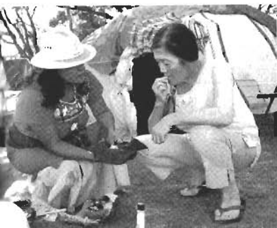
瞑想の儀式「スウェットロジ」に入る直前。儀式を取り仕切るリーダーからそこで使うタバコを渡される