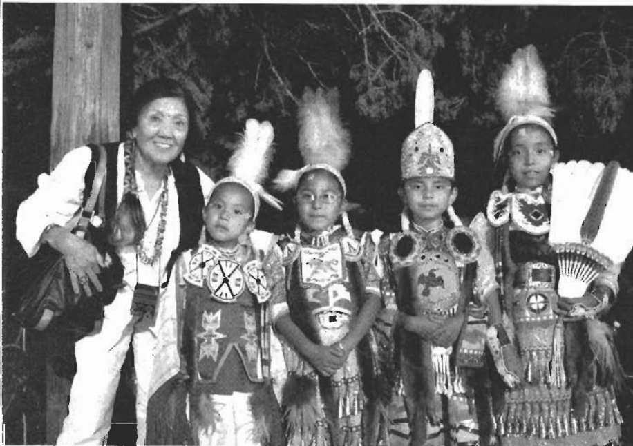
ナバホ・ネイションのデルコンズの町のインディアンフェス会場で。伝統的衣装の子供たちと